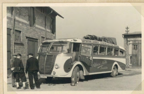
Erste Seite eines Urlaubsalbums aus dem Jahr 1935 [Sammlung B. Stiegler].

die einzelnen Abzüge war das aber ein recht teures Vergnügen und eher wohlhabenden Kreisen vorbehalten. Das änderte sich grundlegend zu Beginn des 20. Jahrhunderts, da Fotos nun zum massenhaften Konsumgut wurden und auch ihre Herstellung nicht mehr an einen Fotografen oder ein Studio delegiert werden musste. Das Fotografieren wurde zur allgemeinen gesellschaftlichen Praxis. Der daraus resultierende höhere Alltäglichkeits-Wert von Knipserfotografien lud regelrecht dazu ein, das Bildmaterial auf den gewünschten gestalterischen Effekt des Albums zuzuschneiden. Doch selbst dort, wo die Bildformate identisch waren, da es sich beispielsweise sämtlich um Abzüge von einem einzigen Negativ-Film handelte, wurden die Fotografien auf den Seiten des Albums kaum ein zweites Mal in gleicher Weise arrangiert. Und selbst wenn dies der Fall war, ergaben sich unterschiedliche Formen von Bilderzählungen. Man wollte eben seine Geschichte erzählen, auch wenn diese sich nicht katego-